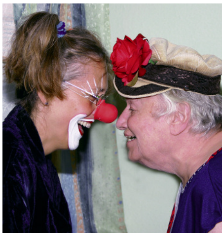
Begegnungen und Berührungen sind für alte Menschen sehr wertvoll und von unschätzbbarer sozialer Bedeutung.