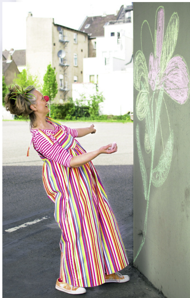
„Blumen wachsen“, ein künstlerisches Projekt mit der Fotografin Sandy Craus.

Das mögen die kranken Kinder sowie alle anderen Kinder gern. Die einfachsten